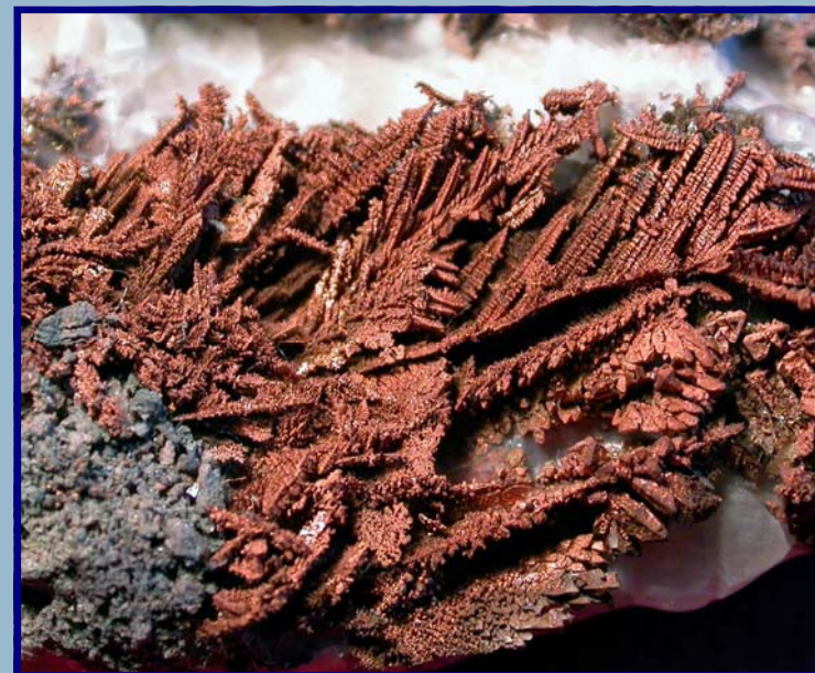
Kobber, Løvøya. Samling: Trond Owe Bergstrøm. Foto: KEL