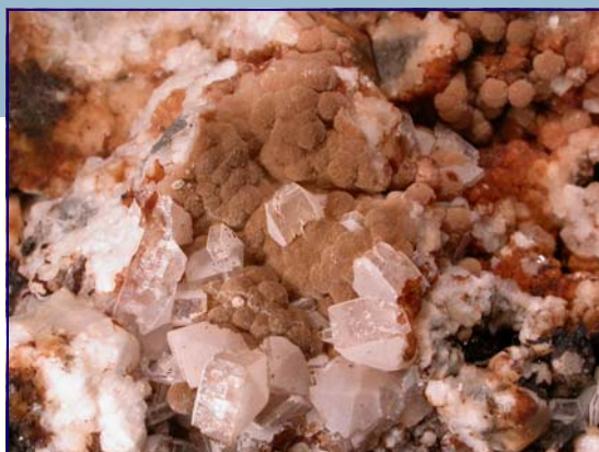
Epididymitt og natrolitt fra Østskogen, Tvedalen