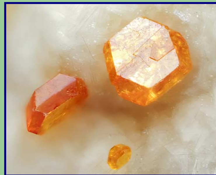
Peterandresenitt, AS Granit, Tvedalen.