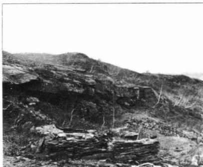
(Utdrag av Sølvbergrimet av Petter Dass 1647-1707, skrevet ca. 1685)

Nu vil jeg mig hensnoe, Til Berthel i Brendaasen Som halvanden Koe Og ingen Kalv paa Baasen. Du var, som først opfandt Den Skatt og skiulte Under, Dig tælles skal Contant I Specie Mynt toe Hunder, Toe Hundred skal du faae, Den haver du til visse, Saa vist som at du saae Din egen Galte pisse. Lav Pungen ickun til Hvor Pengen' i skal tages! Men Haagen Sag-knekt vil Om Renten med dig drages. Han siger: At du har Den Ret til ham afhændet, Du bliver saa vel var, Thi Haagen er skarptændet.