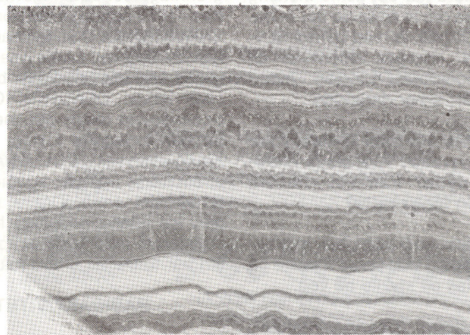
Onyx. Lake county One shotmine. California. Samling A M og F Egsæter.

Jaspis er mer utbredt, - i Syd-Norge særlig knyttet til grønnskifer og grønnstein eller konglomerater dannet fra slike. Bunnlagene i de devonske konglomeratene på Vestlandet kan f. eks. ha pen rød jaspis sammen med boller av grønne vulkanske bergarter, og et devonsk konglomerat i Kristiansund-Smøla-området kan ha rikelig av både rød og grønn jaspis blant fragmentene.