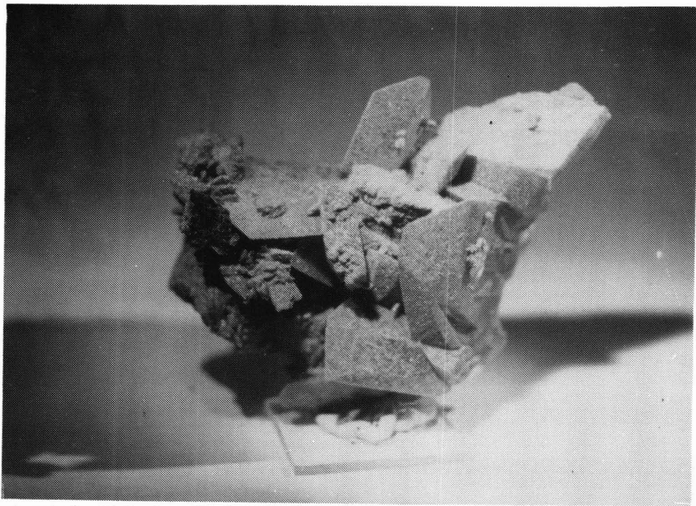
Axenitt fra Ulvik. Lengde på stoffen 9 cm, lengste krystallsidekant 2,5 cm.