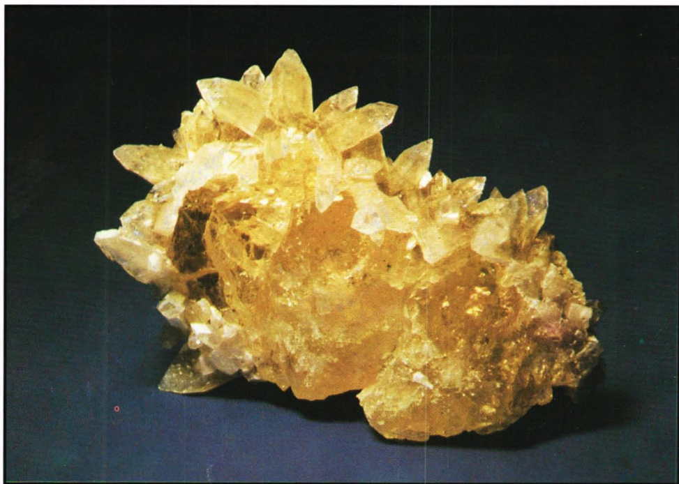
Datolitt xx med fluorapofyllitt. 4 × 2 cm. Samling S. A. Kleivane