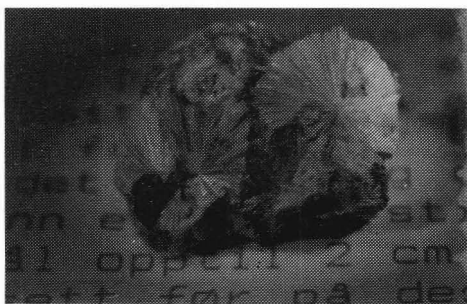
Stilbitkuler med magnetitt. Tverrmål på stuffen 3 cm.

Eit par dagar seinare var eg attende. Då fann eg ei endå større druse nett ved sida av, eller som eit framhald av den fyrste. Innhaldet var omlag det same, men her fann eg lause stilbit kular med tverrmål opptil 2 cm. Det har eg aldri sett før på desse kantar, ikkje andre stader heller. Eit anna mineral som er framand for meg fann eg også. Det er også kuleforma slik som stilbitten – er ikkje radialstrålig – kvit utanpå og for det meste kvit inni,