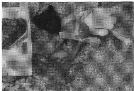
Den fyrste røykkvartsen frå drusa

Bort i bilen etter brekkstonga, så fekk eg han ørlite inn i sprekken. Og så bikka eg på – og blokka gav etter, drog han litt ut. Så løfta eg han rundt med handmakt. Og det var ei druse bak! Rett nok samanrasa, men det er inga ulempe, så får ein ikkje øydeleggje dei sjølve. Eg tok det varsamt ut og så bar det heim, med heile blokka på 70 kilo og druseromsinnholdet som fylte ei heil kasse. Det var nokre fine stuffar i løsmassen. Drusa måla 12×20×30. Mineralane var orthoklas, kvarts, magnetitt, hematitt, stilbitt, biotitt, zirkon (mikro), alt i fine godt utvikla krystallar.