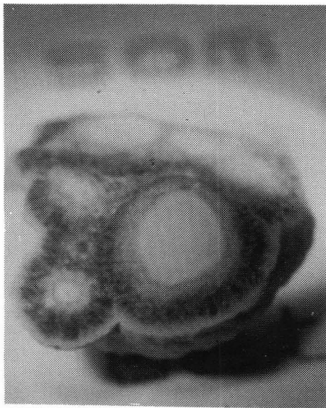
Tverrmål 7 mm.

Så det vart noko nytt, og eg vart nøgd, fekk metta mi om ein kan seia det slik – for nokre dagar – om ikkje anna!