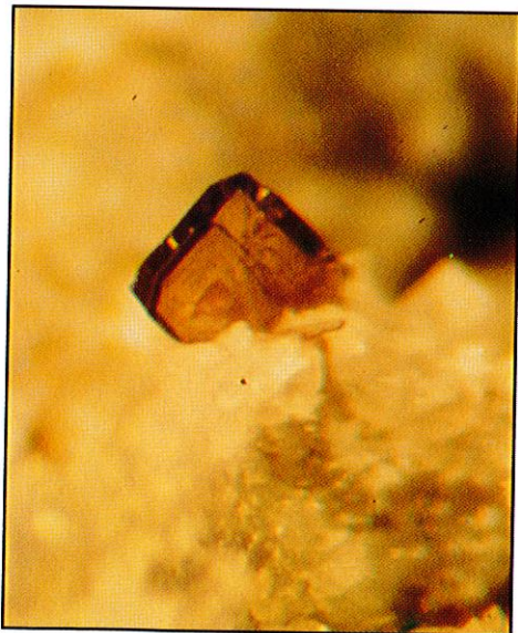
Anatas. Største sidekant 0,3 mm Funnsted: Minge Blygruve, Minge i Østfold