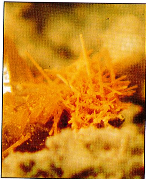
Cerussitt. Krystallaggregat 0,5 mm. Funnsted: Minge Blygruve, Minge i Østfold