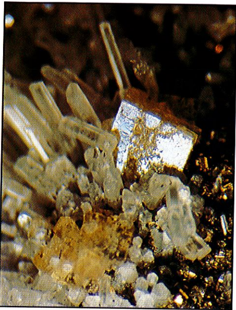
Chabasitt, kalkspatt og pyritt. Bildeutsnitt ca 2x1 cm. Funnsted: Glomsrudkollen, Modum.