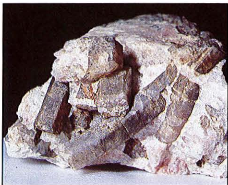
Fenakitt, Tangen, Kragerø