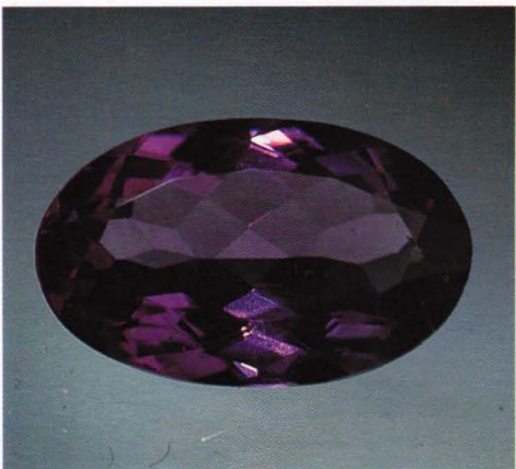
Mjøs-ametysten lar seg fint fasettere til fine smykkesteiner. Sliping: Magnus Svendsli. Samling: Bjørn Skår.

Amethyst from the area around Lake Mjøsa can be cut into beautiful ge-stones.