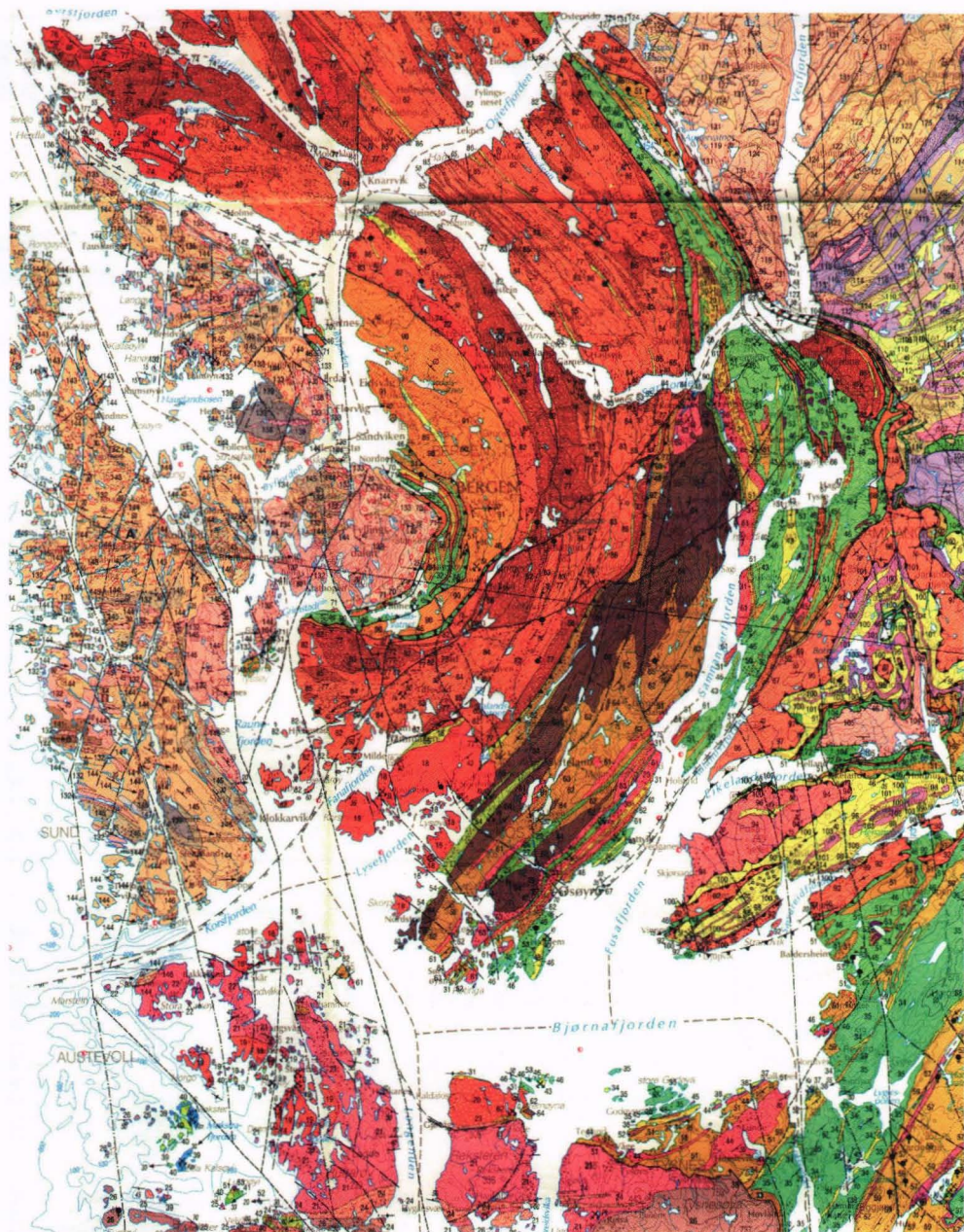
Utsnitt fra bergrunnsgeologisk kart, Bergen