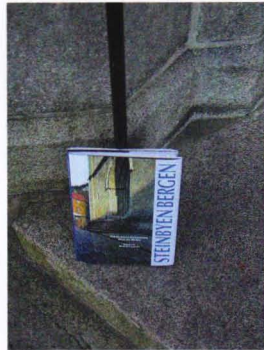
På steintrappa til Sandvikskirken.

Knapt noen by i Norge er så godt beskrevet, bejublet og besunget i bokform som Bergen. Mye av litteraturen står de selv for, de vil gjerne ha det "riktig". Knapt en side ved Bergensk gjøren og laden har gått klar. Til nå, - for nå er de her igjææn.