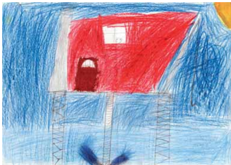
Oljeplattform. Sindre A. Vikenes.