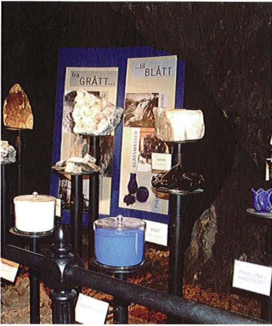
Fra utstillingen i Clara Fund.