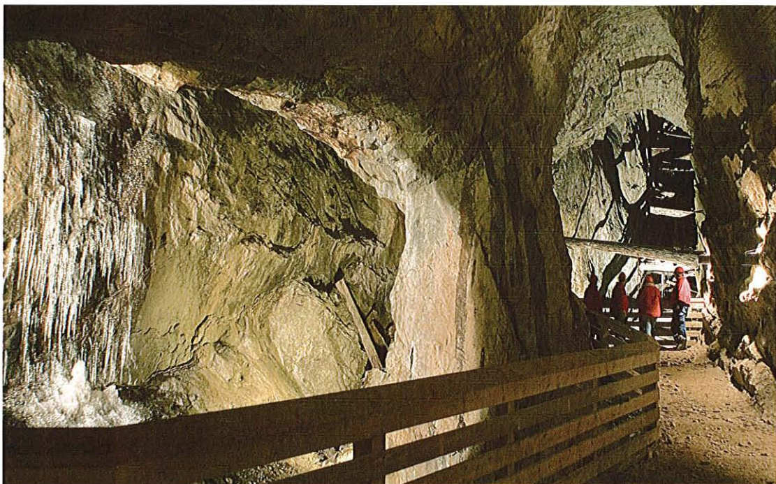
Foto fra Strossen på gruvesafarieren

2007 ser ut til å bli et spesielt spennende år på Blaaferveværket. Mange år med hard arbeid nærmer seg slutten, og lørdag 16. juni skal de nye deler av Skuterudgruvene offisielt åpnes for publikum.