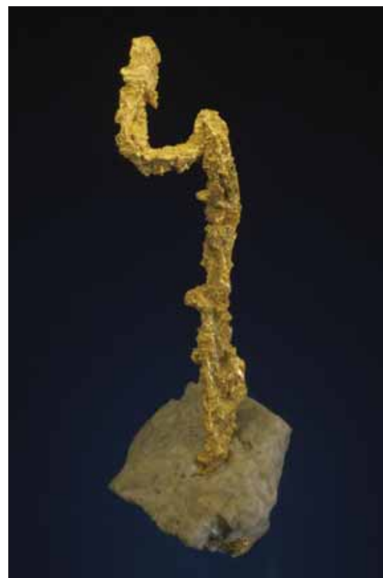
Gull, Golden Crown M, Yarrambat, Victoria, Australia. 8,6 cm. Samling: Ian Bruce.

Vi registrerer at flere og flere nordmenn besøker Europas store messer. Mens det for 15 år siden kun var en håndfull som jevnlig dro ut, ser vi nå en kraftig stigende tendens. Det er faktisk både enkelt og rimelig!