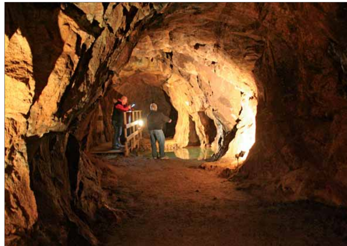
Spennende og vakkert!