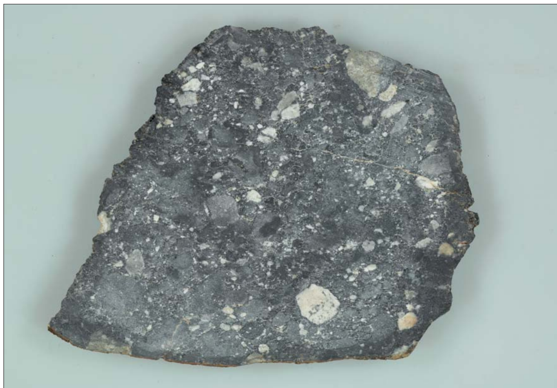
Meteoritten DAG 400, som er den største kjente månemeteoritten så langt.