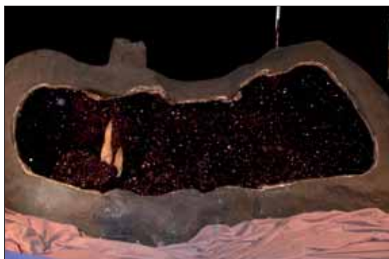
Ametystdruse på over 2 meter.

Nåja, her er jo som før priser for enhver lommebok. Men jeg melder pass når man ser, - prakt-