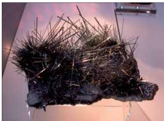
"Pinnsvinet" -stibnitt-krystaller, som neppe hadde vært lett å frakte hjem uskadet!