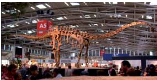
Den plante-etende dinosaurusen Apatosaurus janahpin.

Den 46. Mineralientage München ble som vanlig avvirket i helgen Oktober/ November. Tradisjonen tro dro en gjeng ivrige nordmenn nedover og det var vel ikke noe mindre entusiasme enn før og minst like mange som fjoråret. Det er noe eget med stemningen her og det at alt er under samme tak har sine fordeler i forhold til f.eks. Tucson. I München får du alt du trenger inkludert mat, alt fra fete lunsjer til sushi, uten å måtte bevege seg utenfor messeområdet.