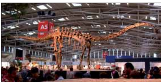
Den plante-etende dinosaurusen Apatosaurus janahpin.

Den 46. Mineralientage München ble som vanlig avvirket i helgen Oktober/ November. Tradisjonen tro dro en gjeng ivrige nordmenn nedover og det var vel ikke noe mindre entusiasme enn før og minst like mange som fjoråret. Det er noe eget med stemningen her og det at alt er under samme tak har sine fordeler i forhold til f.eks. Tucson. I München får du alt du trenger inkludert mat, alt fra fete lunsjer til sushi, uten å måtte bevege seg utenfor messeområdet.