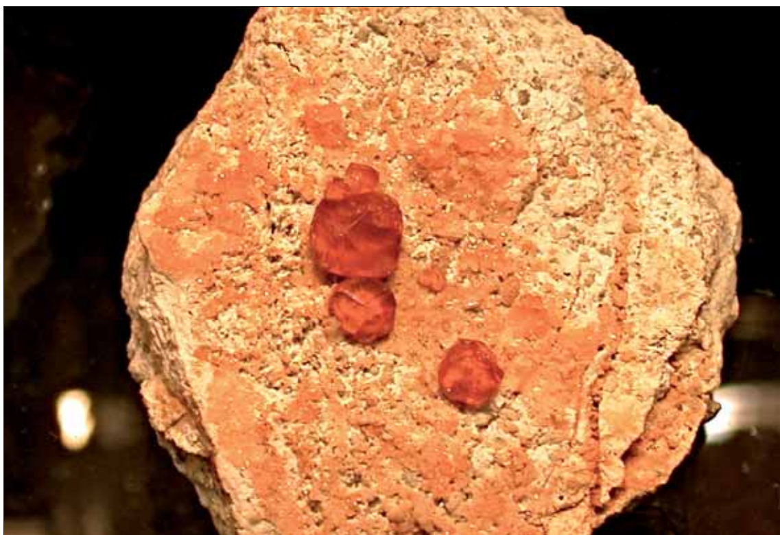
Johachidolitt-krystaller i matriks fra Myanmar.