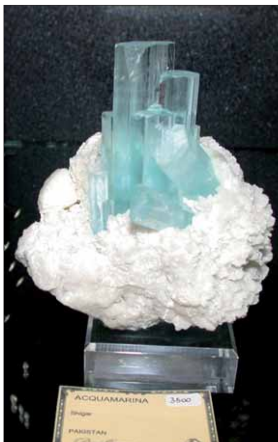
Akvamarin-krystaller fra Pakistan.