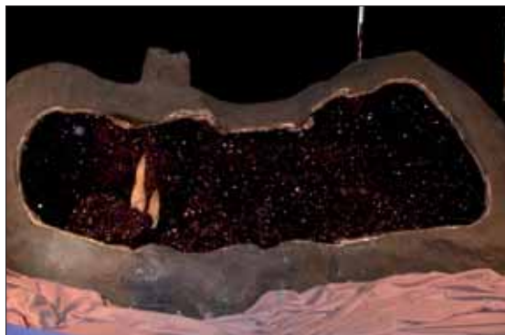
Ametystdruse på over 2 meter.

Nåja, her er jo som før priser for enhver lommebok. Men jeg melder pass når man ser, - prakt-