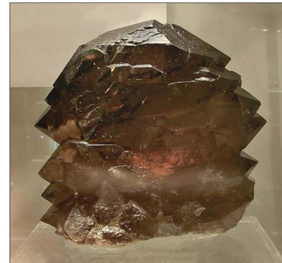
Gwindel til Euro 21000!