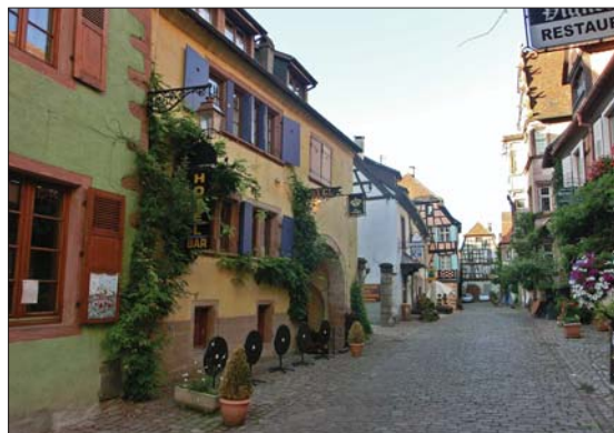
Hotel De La Couronne, Riquewihr.

De siste tre årene har vi valgt å ta fly til Frankfurt og kjøre leiebil til hotellet i Riquewihr. Riquewihr ligger ca en halv times kjøring fra Ste. Marie aux Mines, og er også et greit utgangspunkt for andre aktiviteter. F.eks. besøk til slottet Haut-Koenigsbourg eller et besøk i naturparken