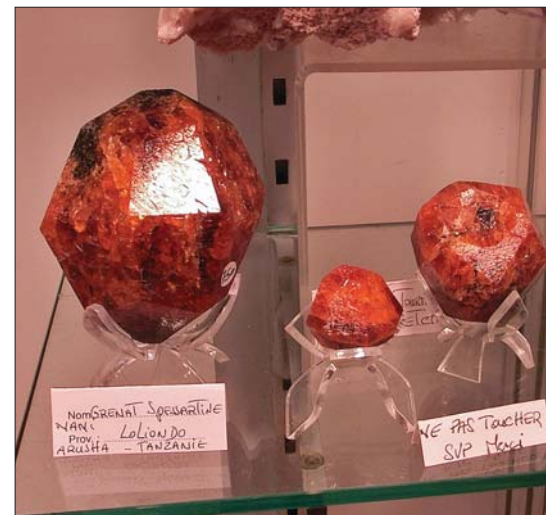
Granater fra Tanzania.