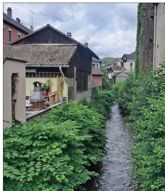
"Elva" som renner gjennom dalen og Ste. Marie aux Mines.

- Euro-Gems, en messe for edelsteiner og smykker (7 000 m 2 , 300 utstillere).