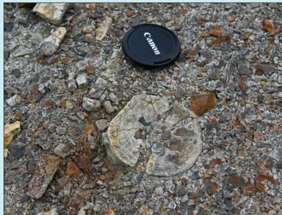
Langs stien kunne vi se en stor ryggvirvel ligge helt i dagen. Ingen tvil om at vi går i en øglekirkegård.

Deretter bar det inn til Pyramiden, og med en russisk guide vandret vi rundt i den forlatte og litt spøkelsesaktige byen. Her sto bygninger og mye inventar igjen etter at byen ble fraflyttet i 1998, da kulleiene ikke lenger ga det som var nødvendige for videre drift. Deretter returnerte vi via Skansebukta og Svenskehuset. Skansebukta var et vakkert sted, der noen rester sto igjen etter