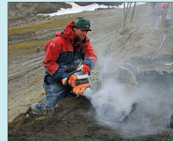
En av Stigs faste oppgaver - kutting av gipskapper.