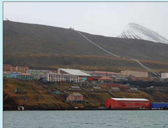
Barentsburg i regnvær. Hus i alle farger her som i Longyearbyen.

Skinbutikken, galleriet i Nybyen og et utall souvenirbutikker ble besøkt og vi fant mer enn nok av fristelser.