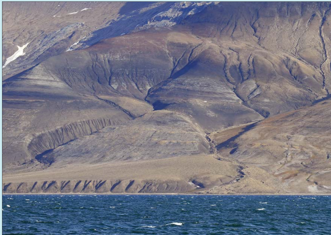
Her er en del av den marine kirkegården som øglegraverne utforsker. Leiren kan skimtes med et hvitt telt midt i bildet.

Takk til våre støttespillere under Svalbard-oppholdet