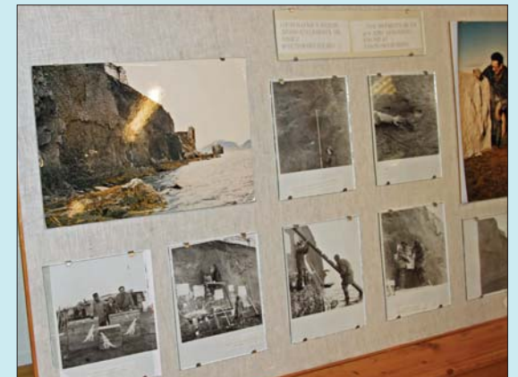
Naturhistorisk museums ekspedisjon til Festningen på 60-tallet var også presentert med mange bilder.