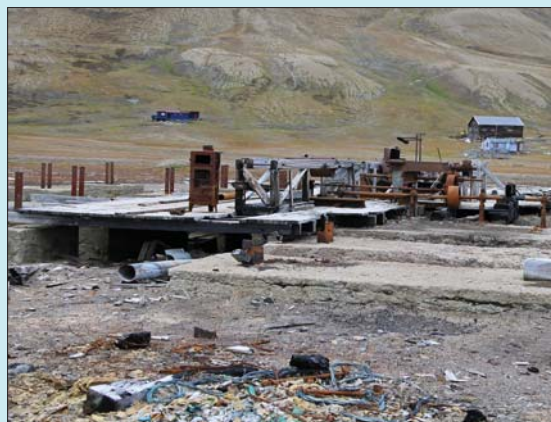
Naturvern og fredninger passer ikke alltid sammen. Her et eksempel fra Hiorthavn.

Selvsagt hadde vi også tid til å rusle rundt i Longyearbyens gater og tilbudet var bredt. Coop, den eneste matvareforretning i Longyearbyen, var et nødvendig sted, da vi stadig trengte litt påfyll. I samme bygg finner man for øvrig også Nordpolet med sin eksklusive Svalbard-cognac.