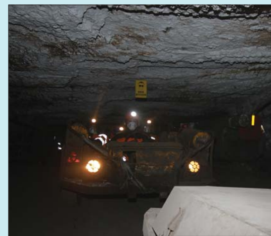
En må ligge helt flat under transport i Olemann.