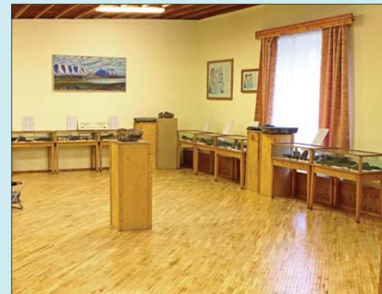
Fra den geologiske salen i Pomormuseet. Mineraler og fossiler fra Svalbard.

hval og laks, kom vi frem til Barentsburg. Vi kunne nok tenkt å ha sett byen på en solskinsdag, for denne dagen virket den utrolig trist med dystre bygninger og kullstøv i luften. Også her ble vi guidet en runde før den enkelte kunne besøke Pomormuseet (med en geologisk utstilling!), kjøpe souvenirer eller hygge oss med en iskald vodka i baren på det eneste hotellet. Dette er den mest populære turen til HTG