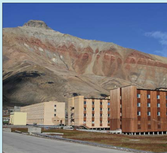
De solide boligblokkene i Pyramiden står fint ennå, men uten vedlikehold vil forfallet komme raskt i dette tøffe klimaet.