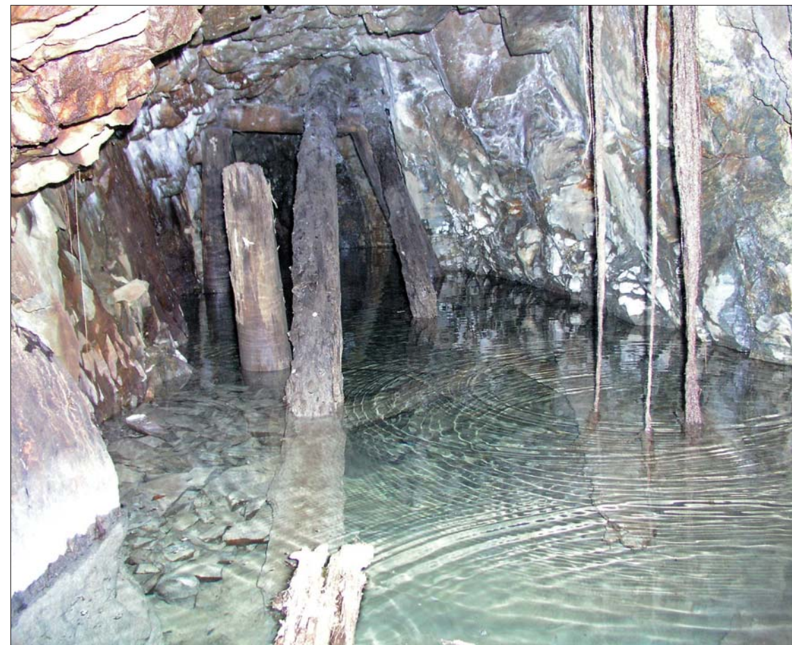
Den forsvunde gruve.

En delvis vannfylt stoll med solid tømmersteking av hengen (les taket) innover. Legg merke til den fine tømmerportalen midt i bildet! Ringene på vannspeilet forteller jo sitt om dryppelydene som tidligere fortalt.