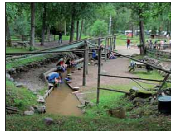
Gullgraverområdet og ivrige gullvaskere.