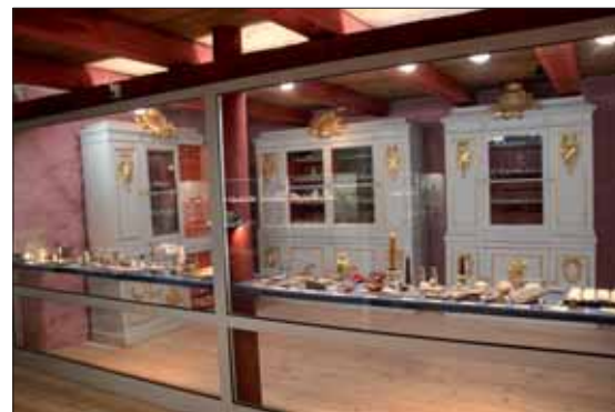
Äldfors gruvmuseum holder til i Stenhuset, også kallt Gullmagasinet, som ble bygget i 1868-69. Fra 2001 har bygningen huset den Bielkeska mineralsamlingen og i tillegg en interessant gruveutstilling.