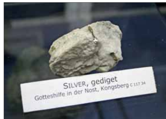
Noen flotte norske prøver er også representert i Äldfors gruvmuseum.