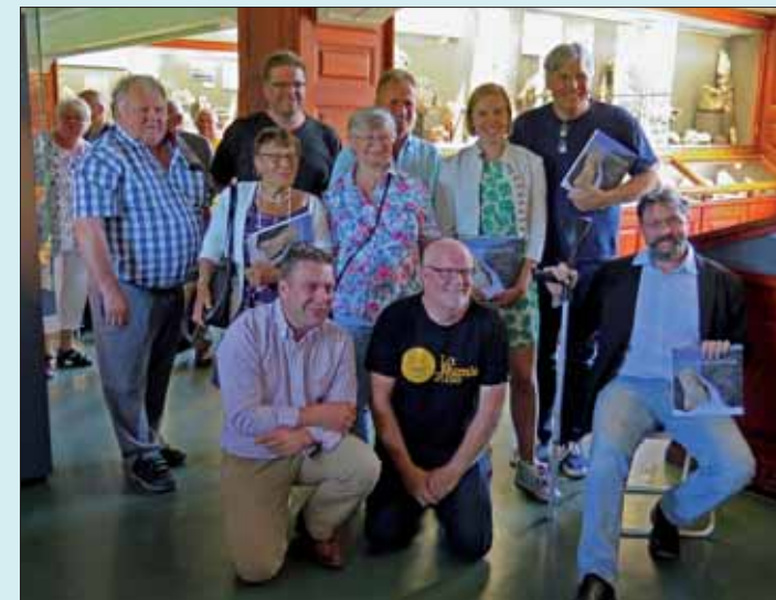
Fra boklanseringen på Naturhistorisk museum 14. juni. Forfatterne sammen med noen av de som har funnet meteorittene i boka.

Så er boka endelig her. Flere av oss har via annonse i STEIN (1-2014, s 13) eller facebook forhåndsbestilt boka, som ble omtalt som "norsk praktbok om de norske meteorittene". La det være sagt med en gang: Boka skuffer ikke, den svarer absolutt til forventningene. Dette er en praktbok! Gjennom tidene har ulike bøker om meteoritter blitt utgitt på norsk. Men denne er annerledes: Den er en bok om norske meteoritter. De 16 norske meteorittene presenteres med god layout og flotte bilder; både av selve meteorittene, av tynnslip av disse og ulike bilder som illustrerer historien rundt funnet av dem. De fleste bildene er tatt av Thoresen eller Selbekk og er av "praktbok"-kvalitet og er en fryd å se på. Det er dog et minus at ikke størrelse på objektet eller bildebredde oppgis for en del av de avbilde meteorittene. Kanskje er dette med hensikt - boka kan tross gode bilder ikke erstatte det å selv se meteorittene der de hører hjemme - på Naturhistorisk Museum.