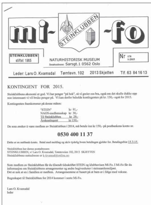
Forsiden på den første og den siste utgaven av Mi-Fo, Steinklubbens klubbavis.