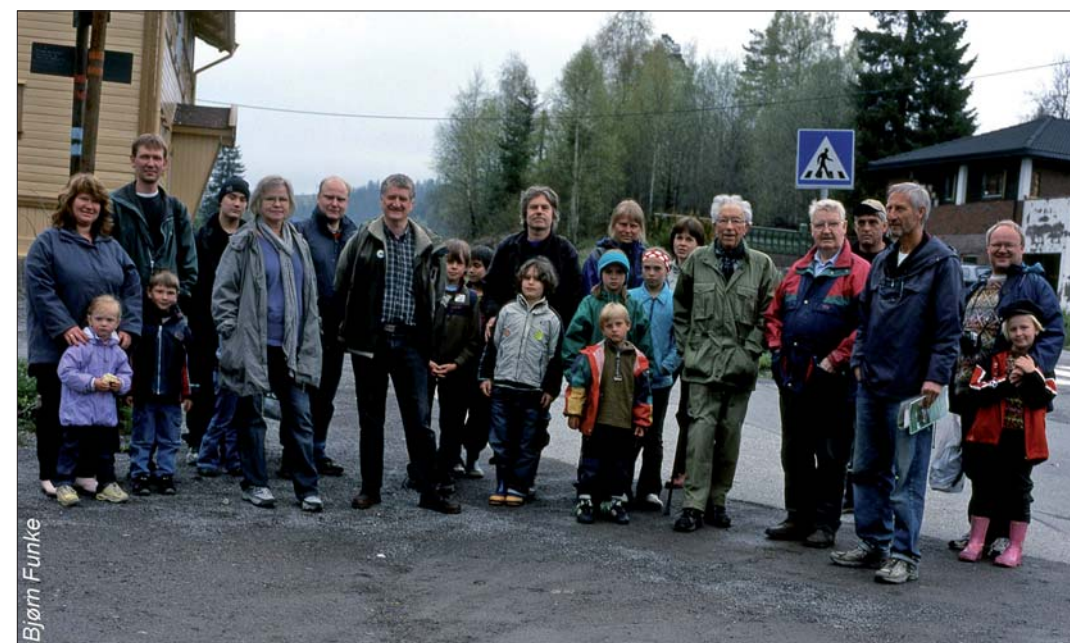
Steinklubben på Grua jernbanestasjon 22. mai 2005, 40 år etter den aller første steinklubbturen.