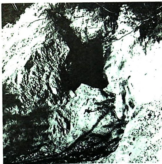
Tveitsto Flussspatgruve. Den øvre stollen.

Litteratur: Falck-Muus, Rolf: Brynesteinsindustrien i Telemarken. Norges geologiske undersøkelse nr. 87, årbok for 1920 og 21, 1922.