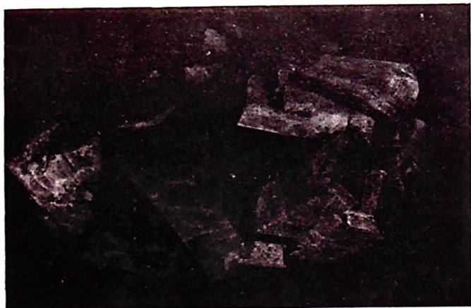
Mikroclinkrystaller i kvarts, Moss Pukkverk.

Mikroclin er den vanligste og viktigste feltspat i granittpegmatitter. Mikroclin er den triklone lavtemperaturmodifikasjonen av KAlSi_3O_8 . Perthittinnleiringer av albitt er vanligvis synlig med det blotte øyet og albittinnholdet varierer fra 15 til 32%. Anorthittinnholdet (Ca-feltspat) er alltid under 1%. Fargen er vanligvis hvit, grålig, gullig til rosa. Som en sjeldenhet opptrer den grønne amasonitten. Krystalliseringen av mikroclin fant sted sent i pegmatittdannelsen. Bare kvarts krystalliserte senere. Derfor kan mikroclin inneslutte krystaller av andre og sjeldnere mineraler. I pegmatitter som er spesielt rike på kvarts er ofte mikroklinen utviklet som store og velformede enkeltkrystaller innesluttet i kvartsen. Således har det i Iveland (Stelibruddet på Tveit) vært funnet krystaller med sideflater som var over 6 meter lange og som må ha hatt en vekt på over 100 tonn. Meget betydelig mindre, men allikevel relativt store mikroclinkrystaller er utstilt i vestibyen på Mineralogisk Museum i Oslo.