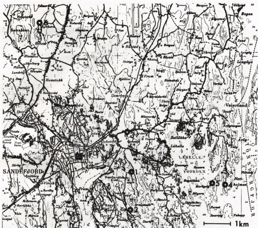
Fig. 1. Granatforekomstene ved Sandefjord.

Granater fra syenittpegmatittganger i Oslofeltet er relativt sjeldent og har tidligere bare vært funnet ved grensen mot basalt, f.eks. på Stokkøya i Langesundsfjorden og ved Bjørkedalen. De senere år har det imidlertid også vært funnet granater ved Sandefjord. Denne artikkelen skal ta for seg de lokaliteter som hittil er oppdaget og gi opplysninger om lokalitetene og de mineraler som er funnet her. Noen av granatene er også analysert ved hjelp av røntgenspektrografi for å fastslå hvilke granater som er funnet og hvor i blandbarhetsrekken de befinner seg. Nummeret på lokalitetene refererer seg til kartet (fig. 1).