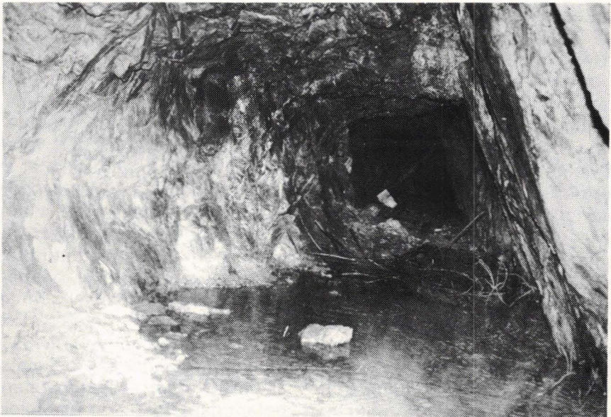
Fra hovedorten i gruva