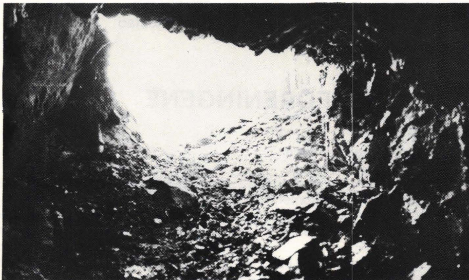
Fra den igjenraste dagåpningen i hovedorten

Mange er nok de som gjennom årene har tatt veien fra skytebanen ved Vågård og opp til Vælsvann, men få har vel hatt kjennskap til gruvene som ligger ca. 100 meter fra veien, ikke langt fra skytebanen. I år er det 75 år siden driften ved gruvene ble innstilt. Og like som det med tiden blir vanskelig å finne noen til å berette om tidligere drift ved gruvene, like sikkert viskes sporene ut i marka. Men den som idag gjør seg en ekstra sving innom gruveområdet vil kunne finne rester av slagghaugene, rester av grunnmurer, noen av de vannfylte synkene 1 og den nesten igjenraste dagåpningen til hovedgruva.