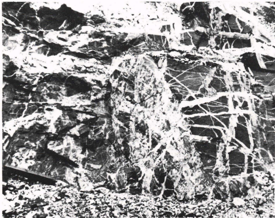
Ganger av anorthositt i amfibolitt (Skattøragneis).

Berggrunnen på Midt- og Sør-Tromsøya består hovedsakelig av avsetningsbergarter som er sterkt omdannede. Av disse kan det skilles mellom tre grupper: 1) Lys grå, dels hvit marmor («krystallinsk kalkstein»). 2) Glimmerskifer, ofte gneiskatig. 3) Mørk kalksilikatskifer, stedvis gneisaktig, som hovedsakelig består av mineralene hornblende, pyroksen og granat. Herunder har vi også den forholdsvis sjeldne bergarten eklo-