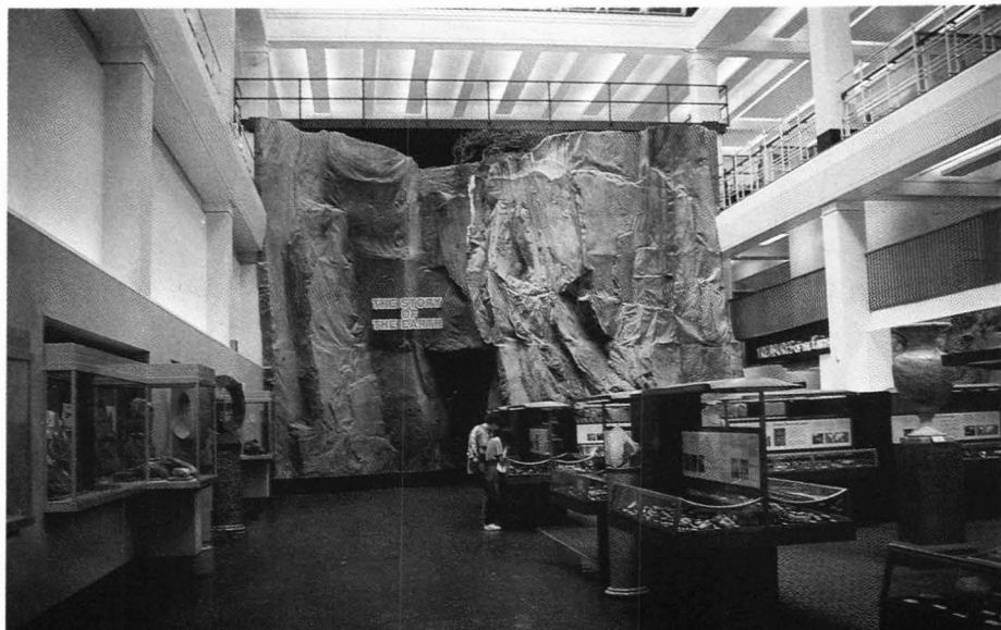
Første etasje med smykkeavdelingen og den kunstige fjellveggen i bakgrunnen.

Med det samme en er på traktene bør man også stikke innom Natural History Museum, det er rett rundt hjørnet, med inngang i Cromwell Road. Det første man ser når man kommer inn her er skjelettet av en Diplodocus. Med sine 27 meters lengde og 6 meters høyde skal det godt gjøres å ikke se den. Rundt denne finner man flere andre dinosaurskjeletter, men alle de andre liksom forsvinner i forhold til «storebror» Diplodocus. Ellers finner man rundt i huset en meget interessant utstilling