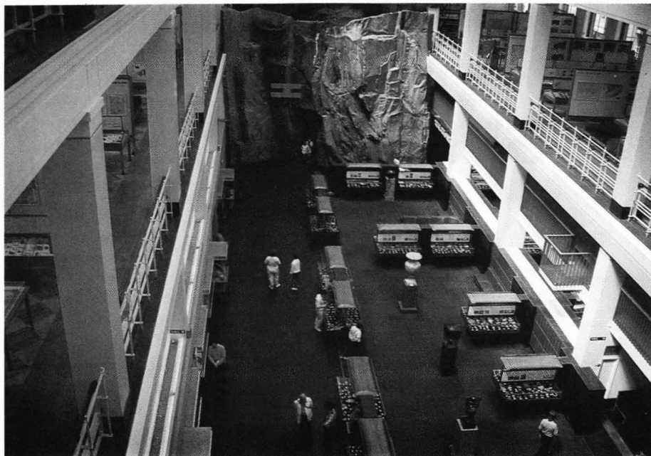
Oversiktsbilde over første etasje, tatt fra fjerde etasje

Hvis man kommer ut av museet og er litt tørst etter den noe tørre og litt støvete museumslufta, er det bare å gå til venstre ved utgangen, deretter første til høyre. På hjørnet rett ovenfor nedgangen til South Kensington undergrunnstasjon, finner man en «real ale» pub hvor man kan leske strupen og hvile beina.