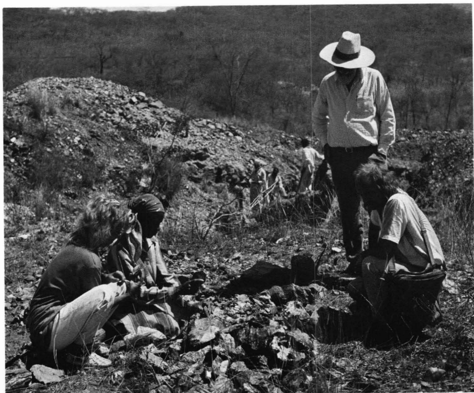
Her blir glimmeren delt for hånd, under jakten på smaragder.