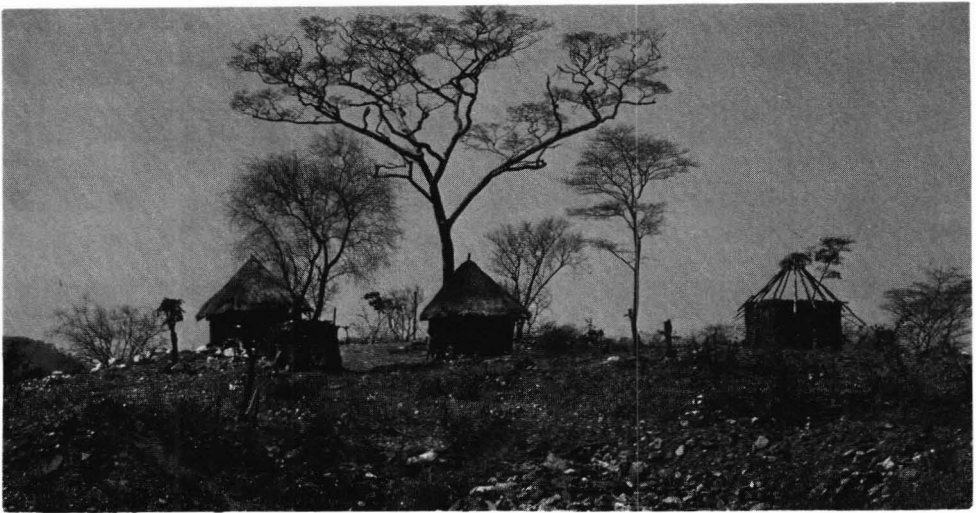
«Landsbyen» ved smaragdgruven.