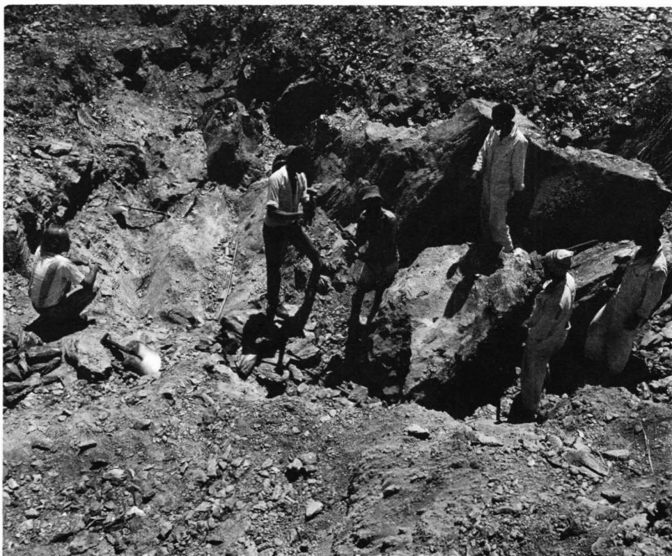
Her brytes gråberget med håndkraft.