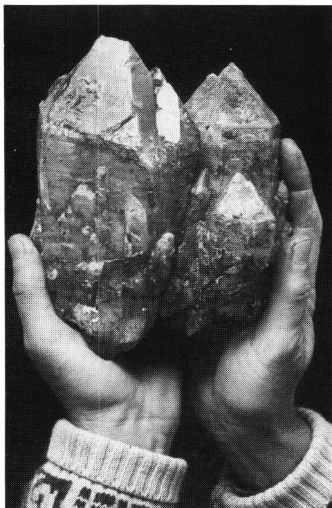
En 2,5 kilos beta i trygge hender.

– Det kan jo være en grunnavgift + at det betales et visst beløp pr. kilo stein. Men hovedsaken er at vi vil ha kontroll med dette slik at det blir skikkelige for-