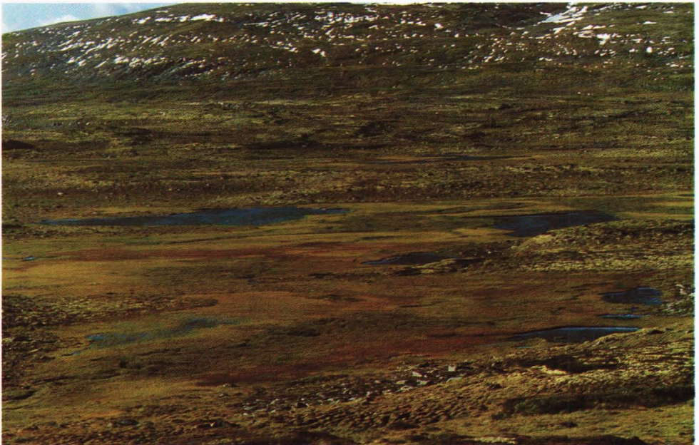
I dette området ble løsblokken funnet