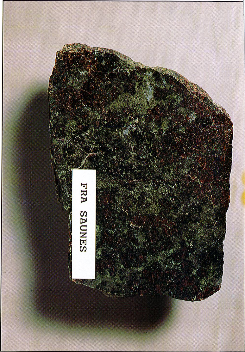
Eklogitt fra Saunes.