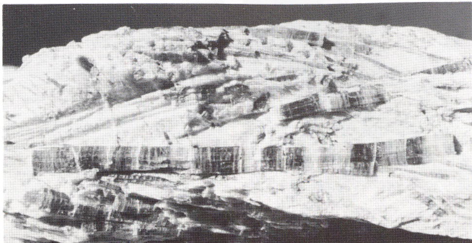
Aktinolit i talkskifer, Vikafjellet. Lengde på krystallen 4,8 cm