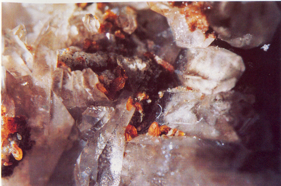
Monazitt på kvarts, Vikafjellet. Krystaller 2-3 mm