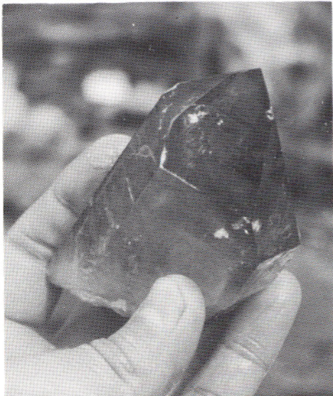
Røykkvarts, Vikafjellet. Høgde 9 cm

var heller ikkje uvanleg. I mindre mengder var det adular til stades i kløfta.