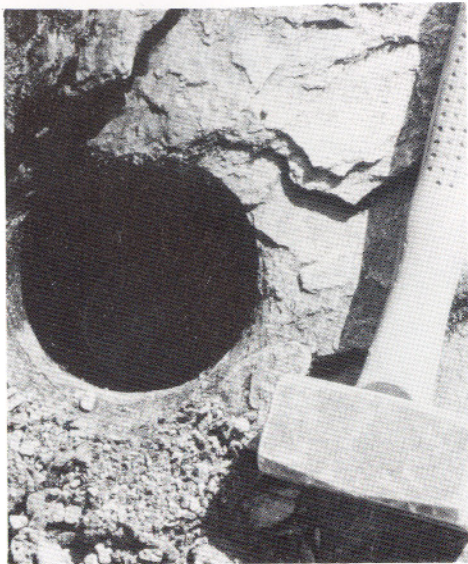
Liten jettegryte, Vikafjellet. Ca 20 cm djup.

I eit anna område lenger inne på fjellet er førekomstane av ein litt anna karakter. Her er det kvartsårer av ein meir hydrotermal type, stort sett massive, varierende i breidd på få cm opp til ein god meter. I druser i desse årene kan det finnast fine bergkrystallar, titanitt, adular, og eit par andre mineral. Det ser ut til at fjellet har sprukke opp på nytt etter at kvartsårene vart danna, slik at kvartsårene har løst frå sidebergarten. I desse sprekkene har det så vakse inn krystallar av røykkvarts. Sprekkeveggane er svært plane, og har sannsynlegvis fått eit tynt belegg av kalsitt før kvartskrystallane vaks ut. Sidan denne kalsitten no har løyst seg opp, er det mogleg å få ut heile krystallplater med kvarts, der undersida er så jamn at ein kunne tru dei var saga ut. Som ein følgje av denne oppsprekkinga er ofte bergkrystallane i kvartsdrusene sundsprengde, slik at ein kan finne splintrar som er rekrystalliserte. Desse kan ha merkverdige former. Det er heller ikkje uvanleg å finne krystallar som har delt seg i to og sidan vakse saman i vinkel. Bergarten i