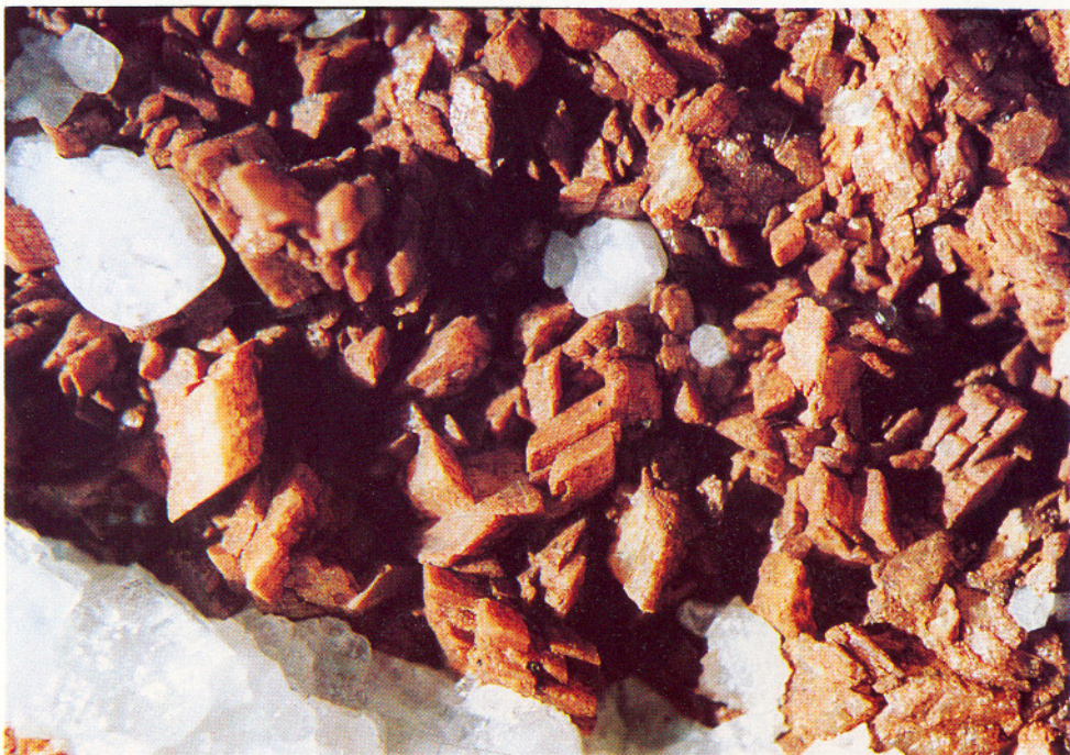
Magnesitt, albitt og kvarts, Vikafjellet. Største krystall 3 mm