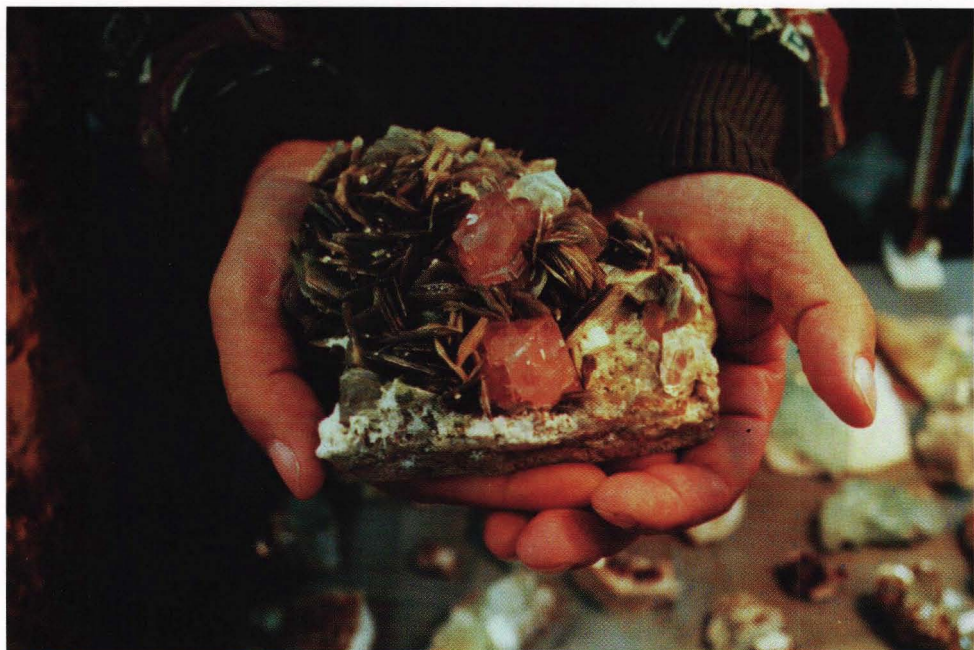
Meget flott – og fremfor alt noenlunde urenset (dvs. ubeskadiget) Apatit fra Pakistan.