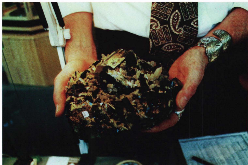
Et nytt funn, sommeren '94. Epidot fra Green Monster Mine, Prince of Wales Is., Alaska