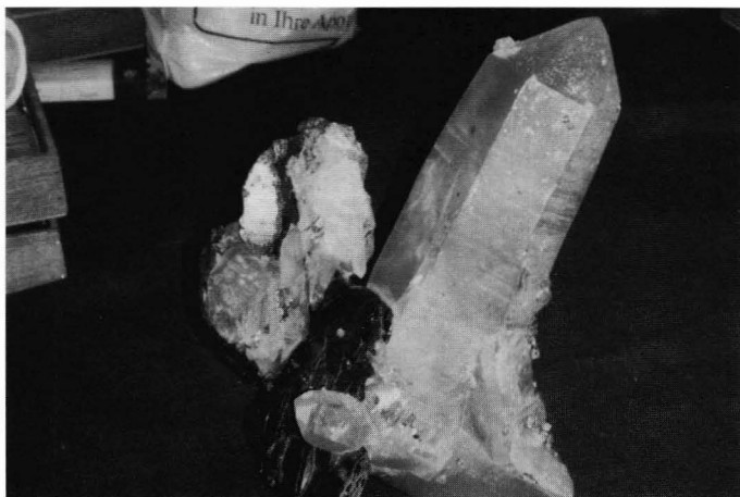
Wolframitt med kvarts, 25 cm. Kara/Oba, Kasakstan

turmalin, kalkspat, flusspat, beryll og topas var det også sjeldnere mineraler - til dels i pene stykker. Noen granitt-pegmatitter fører fosfater som ved omvandling gir opphav til en rekke sjeldne mineraler av særlig