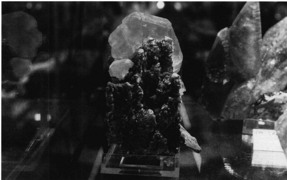
Rosa fluorit fra Hunga/dalen, Pakistan

Det rigtigt nye - det vil sige ting, jeg ihvertfald ikke havde set før - omfattede blandt andet 2-5 cm klare Peridot krystaller