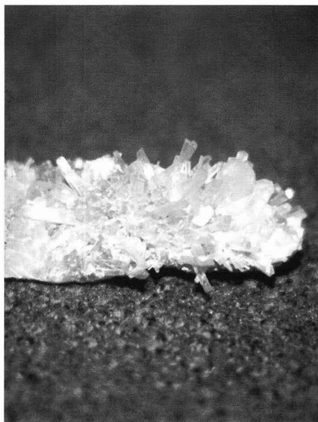
Natrolitt og kalkspat, Trescow/Fritz;e, Tvedalen.

Presentasjonen av NAGS og STEIN var det enighet om at var for dårlig. Den må bli bedre på neste års NAGS-messe på Kongsvinger. Når det gjelder planleggingen av dette arrangementet så ser det ut til at den er godt i rute og vel så det. Representanter for arrangørene fra Odal og Romerike trålet effektivt gjennom messeområdet, spredte sine allerede ferdigtrykte plakater og sikret seg mange av messas utstillere og besøkende for neste år. Lurt!