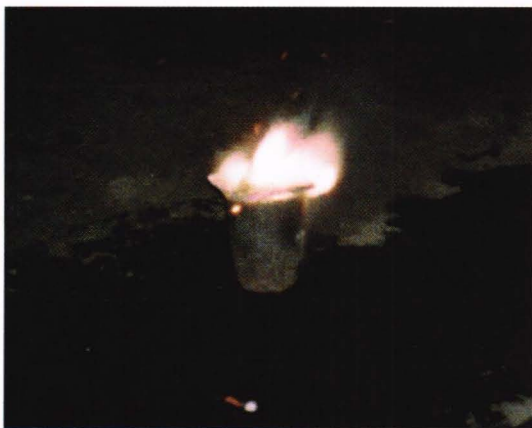
Termitblandingen framført i det fri