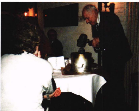
Espeland tømmer ut jern