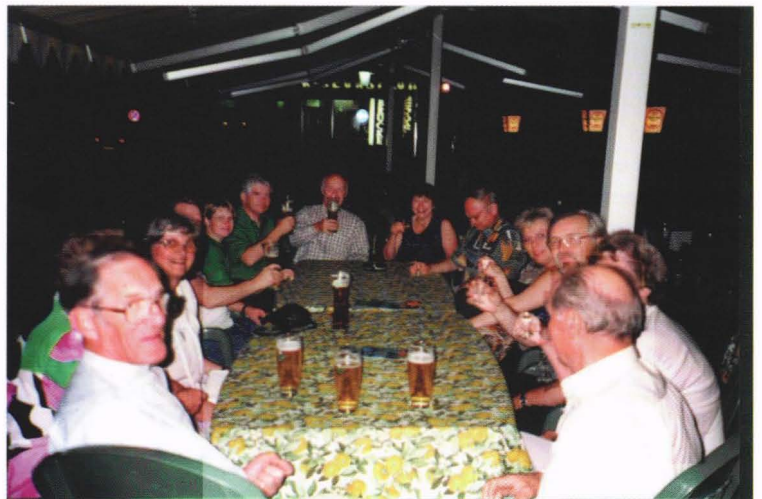
Aftenstund på den lokale pub i Mayrhofen.

blomsterprakten. Deretter bar det rett til hotellet ved Freiburg hvor det også var svømmebasseng som ble fullt utnyttet. Dagen etter skulle vi besøke Wolfach og Grube Klara. Turen gikk på smale bygdeveier, men hvor vi fikk se litt av bebyggelsen utenom motorveier. I Wolfach var det først en liten bytur og deretter bar det for noen rett til gruen, mens andre først tok en tur til Glasshytten som også finnes der. I gruen var det allerede fullt av folk. Tyskere for det meste, men det var alltid plass til noen BOG'er. Her ble det hakket og hamret i søle og skitt og det ble funnet mange fine stuffer, helst i mikroformat, men av mange forskjellige typer mineraler. Men også noen store stuffer av grønn flusspat ble funnet. Med jevne mellomrom kom det en lastebil og tippet nye forsyninger til tippaugene. Det var da om å gjøre å komme først frem til den nye tippaugen og alle midler ble tatt i bruk. Da alle hadde fått nok ble gikk turen retning Rudesheim, hvor vi