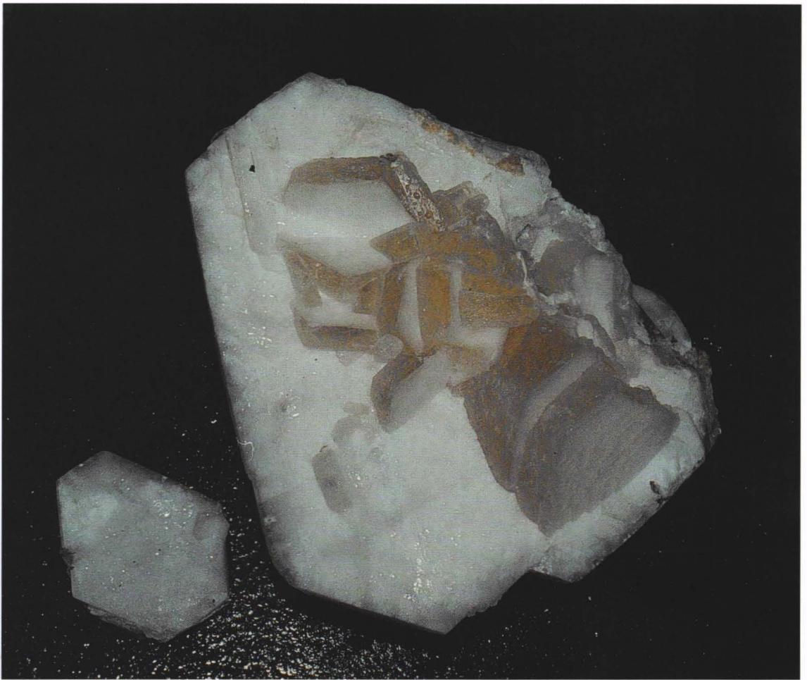
Kalkspat fra Romarheimtunnelen. \varnothing = 14 cm (store X). De klare "vortene" på stoffen er regndråper. Stoffen er fotografert i friluft i det ustanselige regnet. Samling: Øivind Raknes.