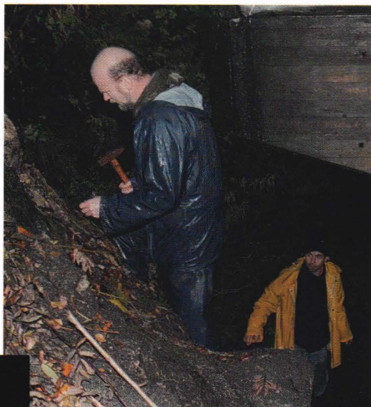
Ivrig banking etter zirkon under E16

Den planlagte turen til Askøy ble avlyst, tanken på å bade i en leirefylt kalkspatdruse i streiregnet ble for mye selv for Bergensere, - hyggelig det, og takk, - det gjorde godt med varm dusj, - innendørs.