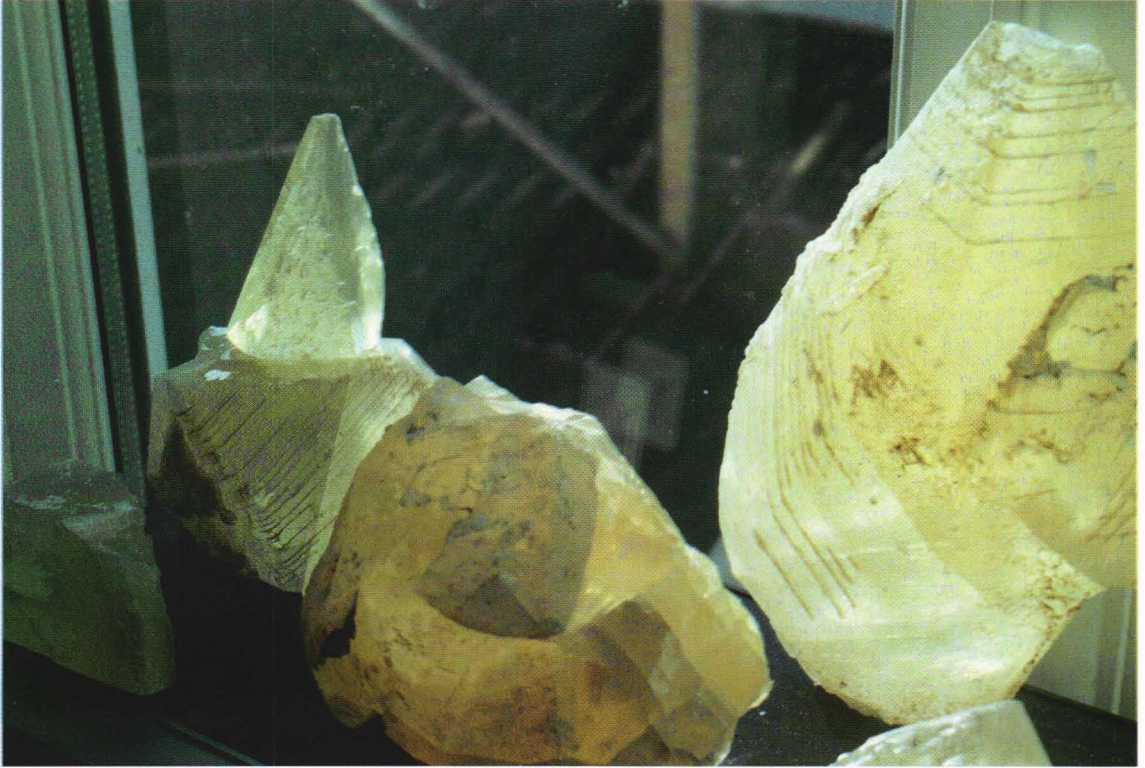
Spaltestykke 6 x 6 x 2,5 cm

gen. Det står krystallene som har sidekanter opptil 10-12 cm og flirer. Og det kan de trygt gjøre, for de fleste som har prøvd seg på å få ut slikt materiale uten skader vet at det er ganske til fånyttes. Men spalteflak er jo også ganske fint?