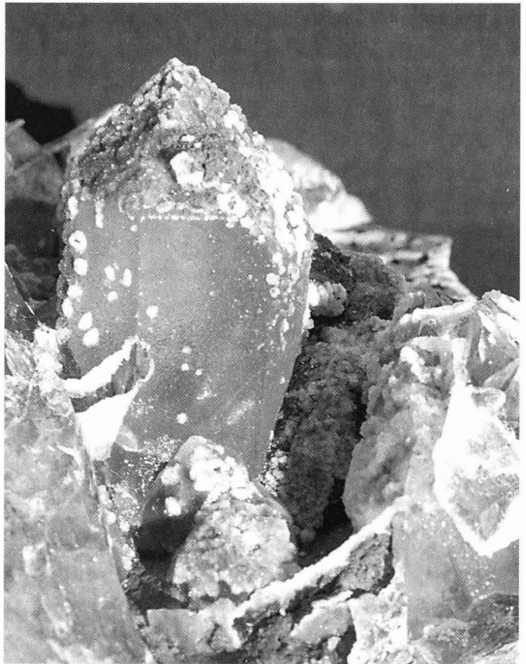
Kvarts, h = 8 cm, fra Reineskarvet eller deromkring med et artig belegg av "sukkerkvarts".