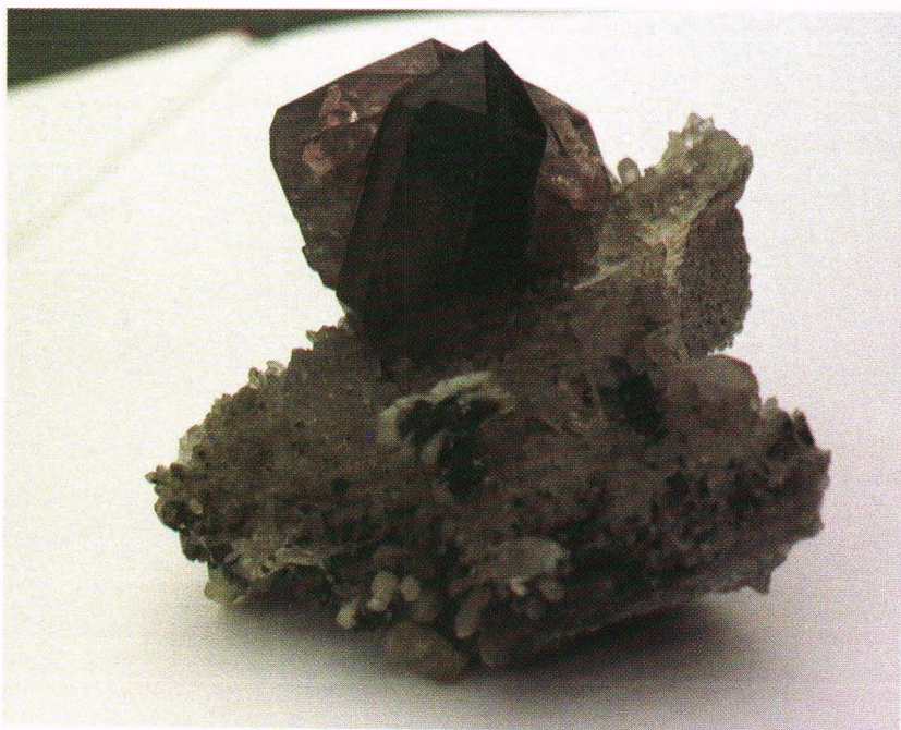
Ametyst fra E18 i Vestfold. Foto fra Gjøvikmessa. Stuffen, h=10 cm, er i Norsk Bergverksmuseums eie.