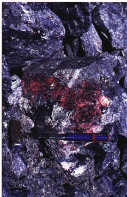
Koashva. Eudialyt med lamprofyllit och ägirin

Åter i Kostamus tankade vi fullt och avverkade de sista par milen till gränsstationen. Där möttes vi av igenkännande hälsningar, och vi och vårt ärende togs nu omhand av en civilklädd tulltjänsteman. Han var mycket vänlig och pratsam, och