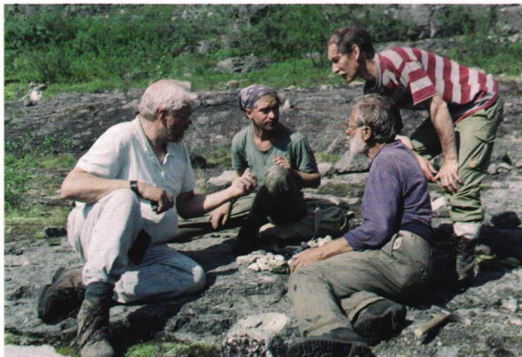
Samtal med en ung geolog vid fersmanitförekomsten.

Valja skall med oss upp på Eveslogchorr idag, den 11, så vi hämtar henne vid kontoret kl 8. På vägen måste vi korsa ett par mindre vattendrag. Ännu en solig dag blir det, och den värsta vandringen hittills väntar