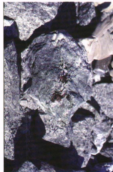
Koashva. Färsk villiaumit

bad om ursäkt för att det skulle kunna ta lite tid att klara av vår tullklarering. Han hade nämligen aldrig förut haft ett fall med utförsel av mineral. Det hela var dock ganska fort gjort. Vi behövde