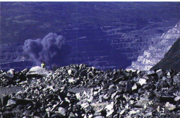
Sprängsalva i Koashva. Vy från Vostotjnaja

Efter en lång och intensiv dag anträdde vi framåt kvällen återfärden till Apatity. Vid midnatt stannade vi