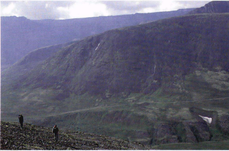
Khibiny. På väg upp till Njorkpahk