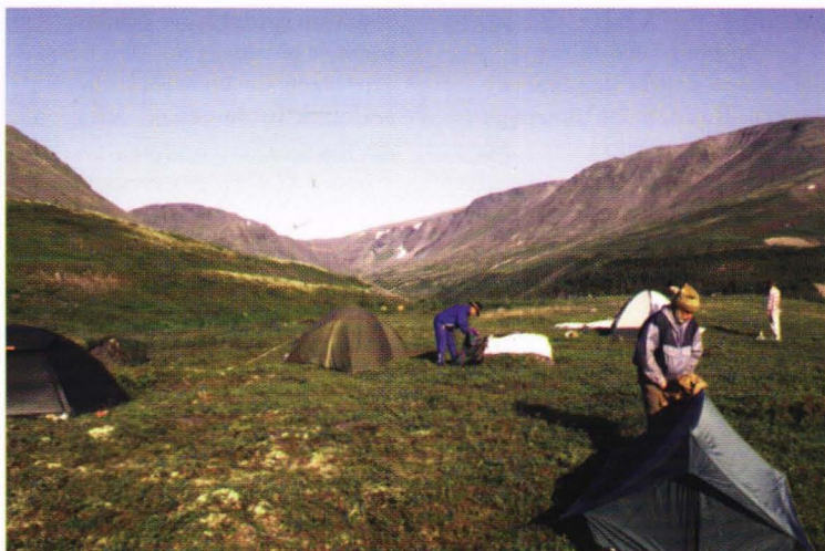
Khibiny. Lägerplatsen vid foten av Eveslogchorr