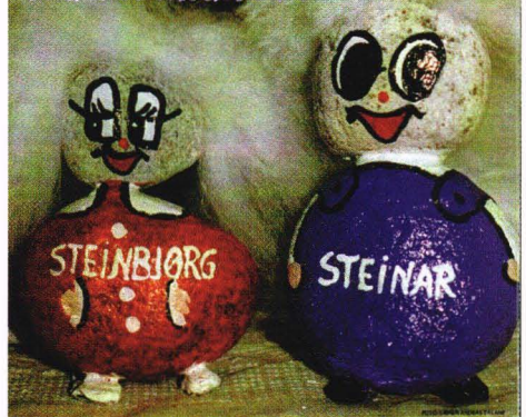
Arvundet stein fra elva ble råmateriale for de første elevbeskriftene ved Årdal skule i Fylfike.