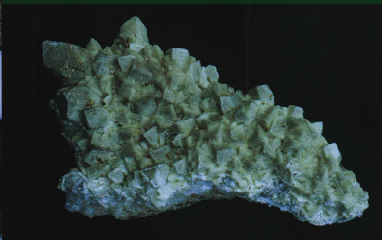
Joda det er Kjorholtmateriale (kalsitt). Bortsett fra hematitten oppe til hoyre, den er fra Tinnsjoen.