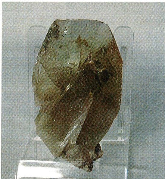
Titanitt fra Radøy. Samling Geologisk museum i Bergen