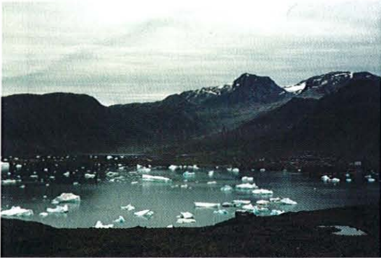
Narsaq med Kvanefjeld i bakgrunnen