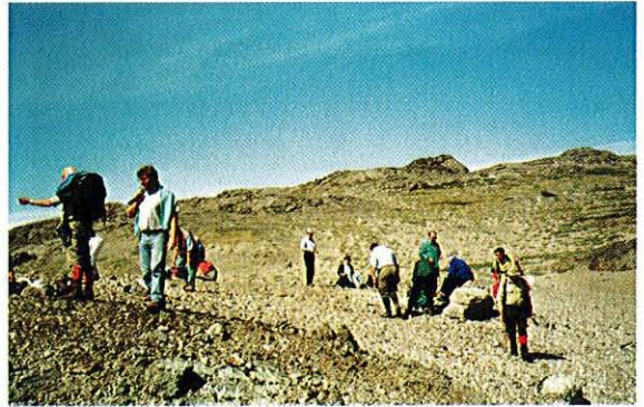
Ut på tur (Narsarsuaq).

Ilmaussaquintrusjonen som strekker seg over to fjorder. Fra Narsaq går det også vei opp til Kvanefjeld hvor det i sin tid ble prospektert på uran. Derfra stammer også Sorensenitten, som ikke er funnet andre steder enn på Grønland. Narsaq er en storby etter Grønlandsk målestokk med ca 1500 innvånere, og i byene begynner et moderne Grønland å finne sin identitet. Industri og fiskeri ved siden av sauedrift overtar for den tradisjonelle fangst-