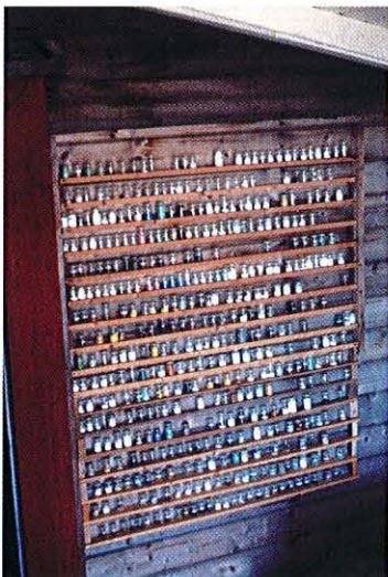
Fra "Tvergastein petrografiske institutt". Anorganiske salter med vakre farger laget på Tvergastein i regnværperioder

For tredje år på rad har undertegnede vært på Tvergastein i Hallingskarvet, 1504 m meter over havet, hos filosofiprofessoren og økosen Arne Næss. Samtalene har dreid som alt fra livsfilosofi til planter og sopp og mineraler. I sitt 88. ende år er han fortsatt levende opptatt av naturvitenskapene, så også