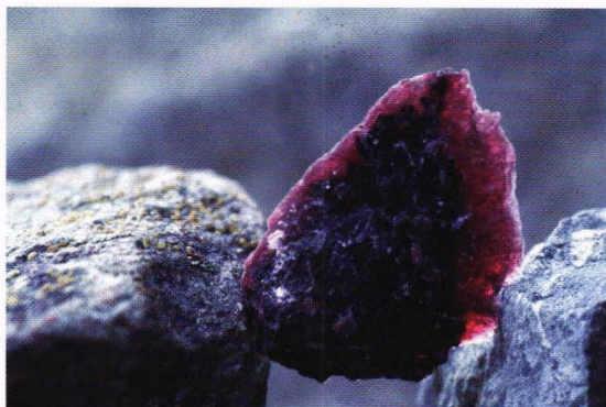
Kromhaldig clinoklor frå eit kromittskjerp på Vindalskammen i Storlidalen i Oppdal. Identifisert av S. Bergstøl. For å få til eit interessant bilde vart det knust mykje stein før det vart ei høveleg flis.

Ein av fjernsynskokkane våre brukar å seie det slik. På førehand gjer ho ferdig retten ho vil vise oss slik at vi får sjå det ferdige produktet utan at vi må sjå at potetene blir koka. Dette