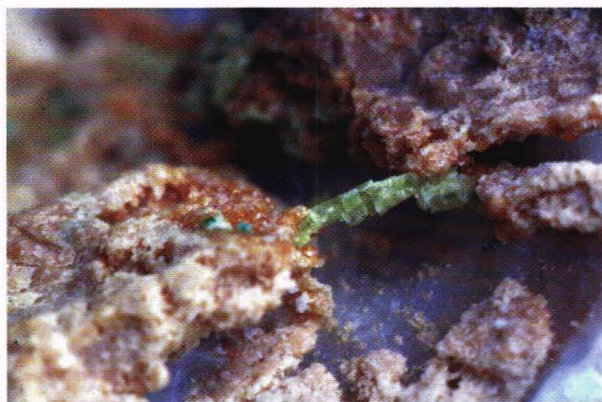
Grøn vesuvian og brun andraditt frå Vinstradalen. Mineralet låg gøymt i marmor som vart fjerna med saltsyre. Granaten er identifisert ved NGU, vesuvian av S. Bergstøl.

Funnet av uvarovitt vart omtala i «Stein» nummer 4, 1994 under «Ryktebørsen». Mineralet er identifisert av S. Bergstøl. Granatane vart plukka frå «grusen» ein får når ein bruker salt- syre på den kontaktmetamorfe marmoren på ein viss plass i Vinstradalen i Oppdal. Den største, granaten i «dungen» er mindre enn ein millimeter i tverrmål. Mineralet ligg i ein matrix som er ei blanding av grossular og vesuvian, (Alv Olav Larsen).