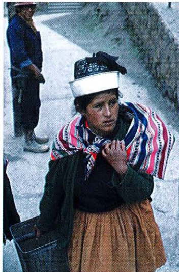
Högsta hattmode i gruvbyn.

Efter några rejäla sug ur syrgastuberna gav vi oss, iförda lånad utrustning, ner i gruvan, som drevs på bly och koppar. Dieselångorna från handaggregaten var täta och larmet öronbedövande. Malmen drogs ut från brytorterna i vagnar med hjälp av ett primitivt linsystem. Personbefordran mellan olika nivåer skedde på rangliga stegar av trä. Trots, eller möjligen tack vare, ett allt