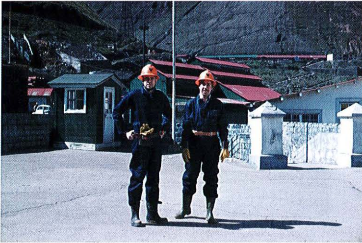
Blekansikten vid gruvan

täckte det fasta berget, lades de döda direkt på marken, varpå täckning skedde med sten. Påfallande många gravhögar såg nygjorda ut, och det visade sig så småningom att olyckor med dödlig utgång bland gruvarbetarna var vanliga. Delvis berodde detta på den rasbrytningsmetod som användes i gruvan, men undermålig utrustning och dålig säkerhetsdisciplin bidrog också.